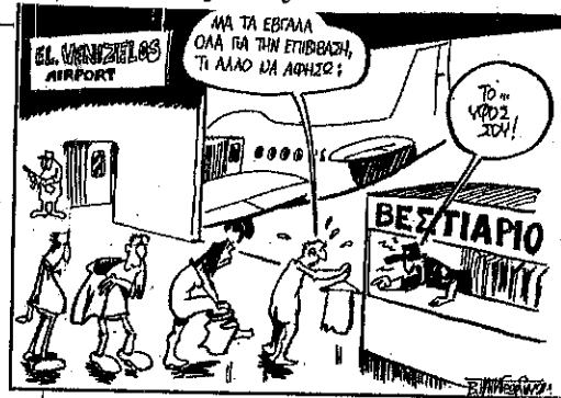
Του Β. ΠΑΠΑΓΕΩΡΓΙΟΥ - ΑΠΟ ΤΟΝ «ΡΙΖΟΣΠΑΣΤΗ»

του πολέμου σήμερα, θα συνεχισθούν και θα ενταθούν. Γιατί τα προβλήματα και οι συνθήκες που τις γέννησαν υπάρχουν ακέραια και διαρκώς εντεινόμενα. Και οι "προσωρινοί περιορισμοί" του Σταθόπουλου θα είναι, πολύ σύντομα, μπουμεραγκ για τους εμπνευστές τους.